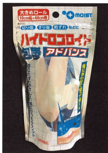
パッケージデザイン